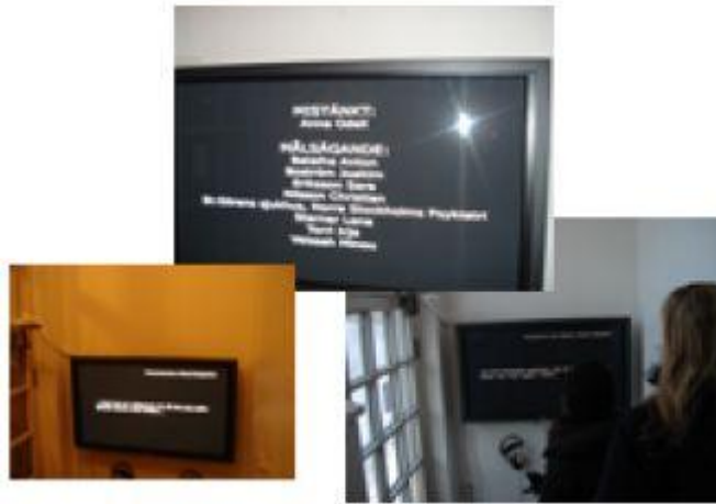
Rättegången en ljudupptagning från rättsalen man kan höra i hörlurar och se textad på en skärm vid utgången från/entrén till Galleri Verkligheten

Jag tycker att jag till fullo förstår vad Odell är ute efter först när jag, som här, sett alla delarna av Okänd, kvinna 2009-349701. Liljeholmsbron, Sju Samtal och Avslöjandet har visats på Konstfack och Kalmar konstmuseum , medan Rättegången och Epilog tidigare visats på Strand i Stockholm. Det är första gången verket visas i sin helhet här i Verklighetens lokaler i Umeå. Syftet var att undersöka vems berättelse som är giltig, att visa att vården inte står för en absolut sanning och att visa psykvården inifrån ur ett patientperspektiv.