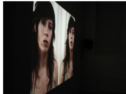
I Epilog har Odell en filosofisk dialog mellan sina två ”jag” bl a om Våldsamt motstånd är möjligt om man inte bemöts med våld från början.

”Verklighetens folk är människor som lever sina liv som folk gör mest. Du och jag. Det är alla vi som gjort livsval som vänstern tycker är fel. Som tycker det är okej med familj, att arbeta, ta semester, ha fredagsmys och titta på ”Så ska det låta” på TV. Som inte vill att politiker lägger sig i våra liv och vår vardag för mycket och som inte ser varje val i livet som ett resultat av förtryckande strukturer. Verklighetens folk ser inte världen genom ideologiska glasögon i första hand. Verklighetens folk har självklart ideologiska uppfattningar, men skriver inte nödvändigtvis andra på näsan hur de ska göra och tycka eller tycker att alla åsikter ska resultera i en ny lagreglering, ett nytt förbud eller ett nytt styrande bidrag. Vanligt folk är obekymrade över märkliga teorier om hur livet ska levas, men blir förskräckta när politiker vill ta till lagstiftning för att ändra deras livsstil.” Enligt http://www.kristdemokraterna.se/artiklar/Verklighetensfolkfragorochsvar.aspx